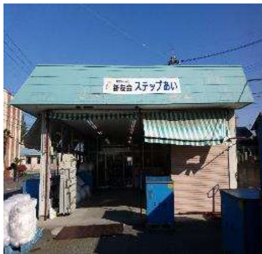
ステップあい外観