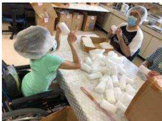
果実の緩衝材折り