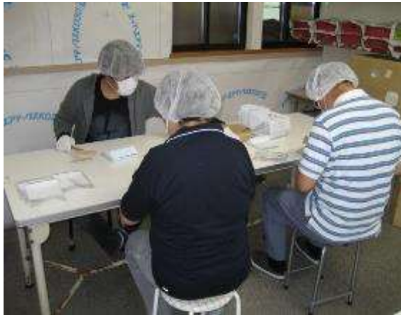
外部受注作業（台紙入れ）