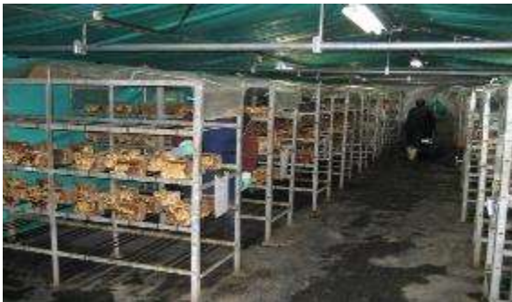
菌床しいたけ（水やり風景）