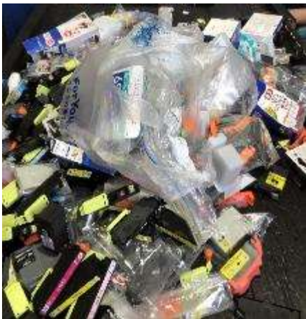
全国から集まるカートリッジを選別します