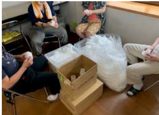
果物ネットの折り作業