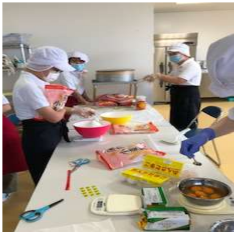
クッキー生地作り