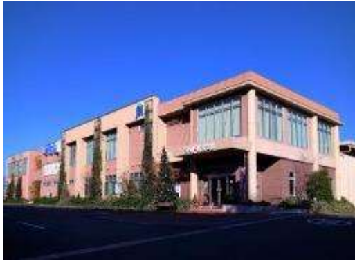
ジット/たいよう外観