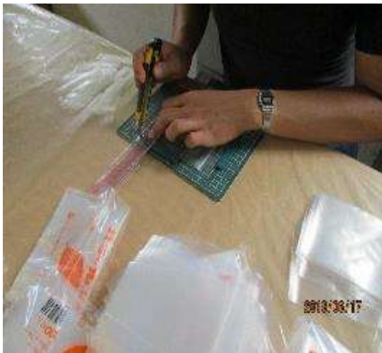
小袋の切り分け作業