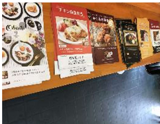
メニュー表にチラシを差し込む作業