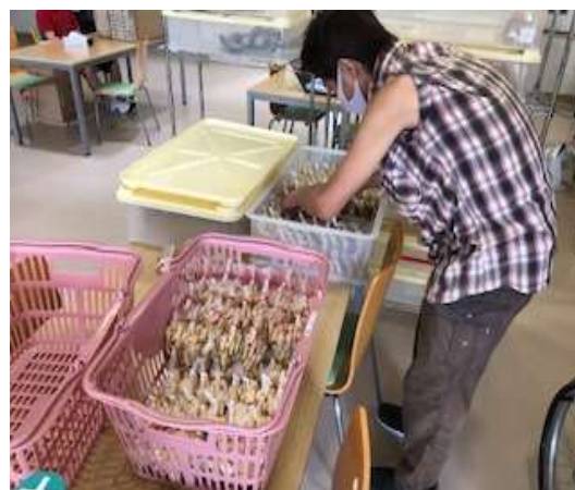
クッキー納品準備