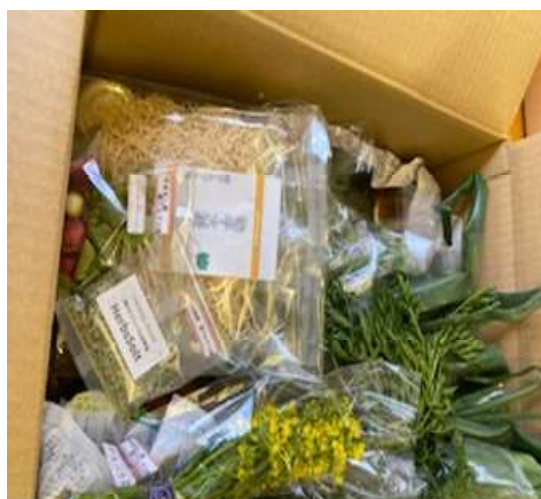
農産物の宅配事業