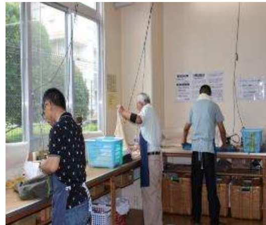
衣類のたたみ作業