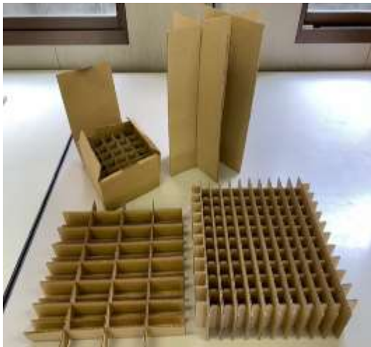
ダンボール（組仕切）組み立て