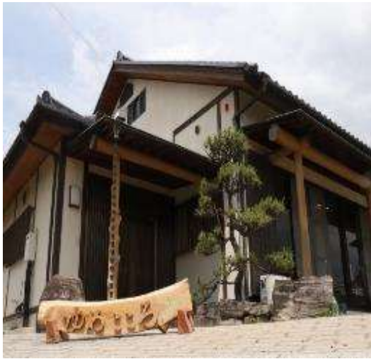
施設外観 心安らく古民家