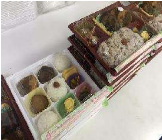
ヘルシー弁当 デラックス弁当