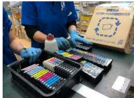
仕分けして汚れをふき取ります