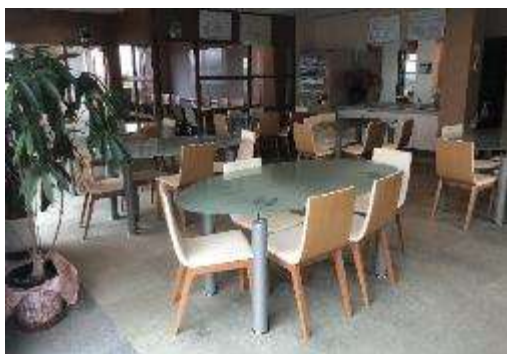
休憩スペース/食堂