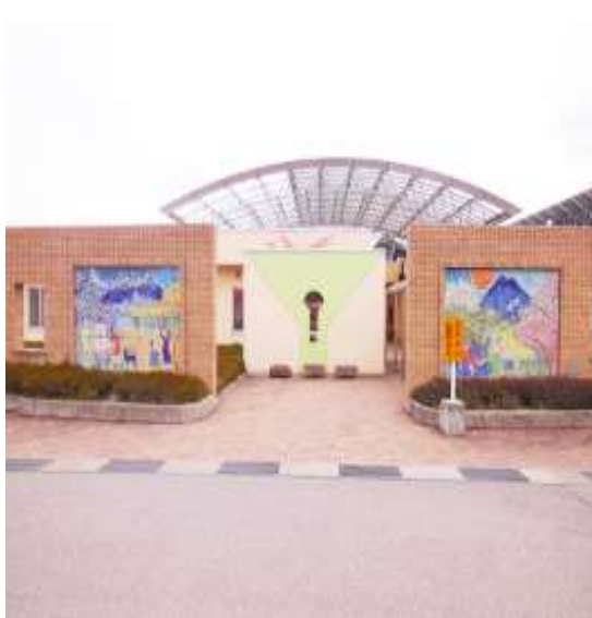
育精福祉センター