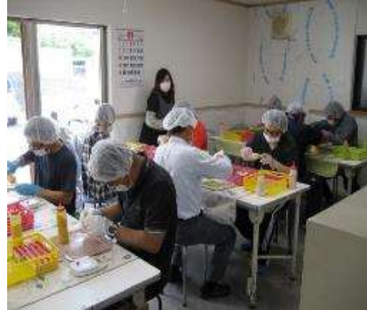
外部受注作業（塩詰）