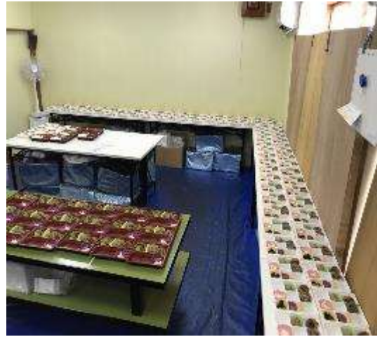
お弁当箱を並べます