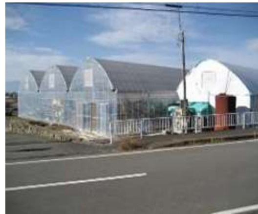
菌床しいたけ栽培（ハウス全景）