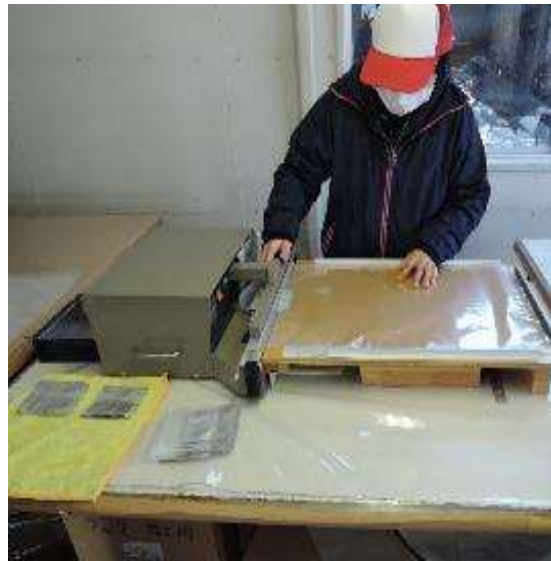
廃棄トナー袋作成作業