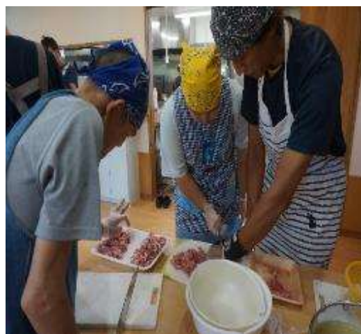
毎週火曜日は調理活動