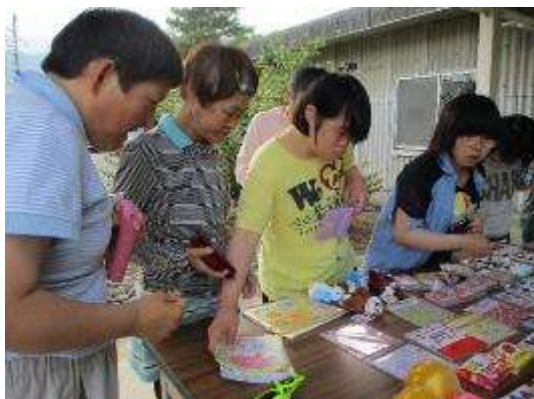
就労班主催の屋台イベント