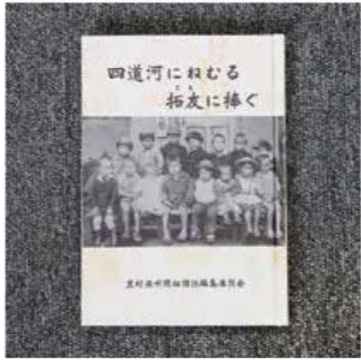
参考文献：『四道河にねむる 拓友に捧ぐ』図書館等にあるので、より詳しく知りたい方はお読みください。