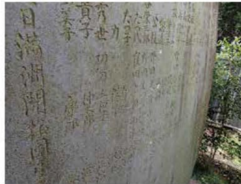
慰霊碑の背面には、犠牲者の名が刻まれる。

このような中、開拓団は度重なる「土匪」の襲来を受けたといわれ、応戦しましたが、戦死者もでていました。弾薬が尽き、負傷者も増え、戦力も著しく低下し、これ以上の交戦は無謀であるし、重軽傷者を同道しての脱出は不可能であるとして、追い詰められ孤立した人々は、自決することに決めたのです。八月十七日、村人の大部分にあたる百四十名あまりが、本部建物に集合して防戦用に支給されていたダイナマイトに火をつけ爆死したと伝えられています。その中には、一歳に満たない乳児から、七十歳を超える老人までいたそうです。 集団自決の報は、大やけどを負いながら生き延びた方が、同胞のいる収容所にたどり着き、悲劇を伝えて息絶えたことにより、今日に伝えられることになりました。また、自決からのただひとりの生存者であった女兒は、中国人の養父母に引き取られ、いわゆる中国残留日本人孤児となって、戦後長く故郷の土を踏むことができませんでした。 昭和三十三年（一九五七）には、この事件の慰霊碑が吉田の諏訪神社境内に建立され、その悲劇を今に伝えていきます。そして現在も、事件のあった八月十七日には、毎年ここで慰霊祭が行われています。 アジア太平洋戦争では、戦場で亡くなった方以外にも、このように民間人も数多く亡くなっていることを忘れてはいけません。この事件は、民間人も戦争になれば否応なく巻き込まれていくことを我々に教えてくれています。