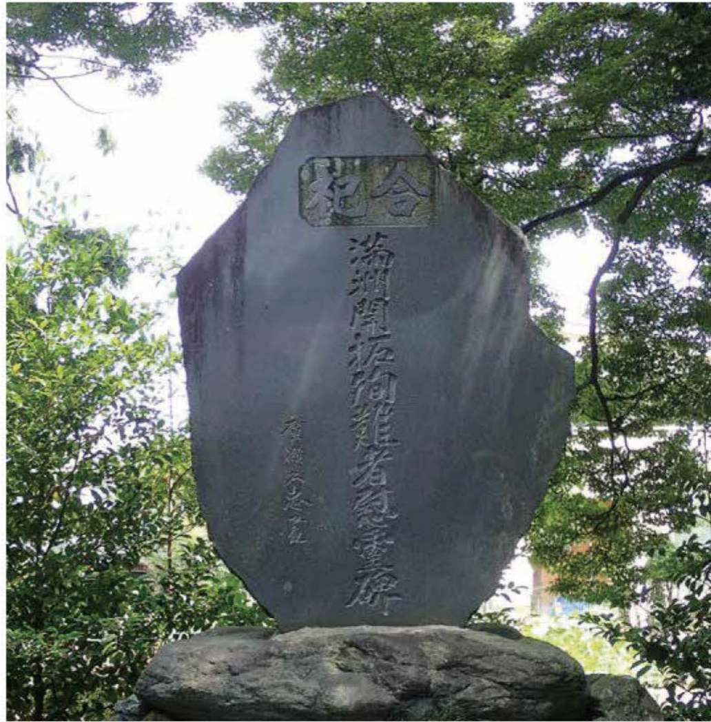
満州開拓殉難者慰霊碑 諏訪神社（吉田）

昭和二十年（一九四五）八月十七日、豊村満州開拓団本部で開拓団幹部ら百四十人あまりが爆死した悲劇がありました。かつて原七郷と呼ばれた干ばつ地帯にあって、養蚕と畑作を主な生業とする零細な農村であった豊村（現在の南アルプス市上今井、沢登、十五所、吉田）が、新天地を求め国の政策によって、旧満州国（現在の中国東北部）の四道河（しどうが、スードーホー）と呼ばれる場所に、分村入植した歴史があります。 昭和十五年（一九四〇）二月に先遣隊が発し、昭和十七年（一九四二）四月に本隊が入植、記録によれば、その規模は、開戦時五十五戸、百六十五人だったと伝えられています。その後も入植は続き、終戦時には、より多くの人が豊村開拓団に暮らしていたことでしょう。 事件は、終戦直後に起こりました。昭和二十年には戦局は悪化の一途をたどり、八月十五日、ついに日本は無条件降伏をすることになります。このころには、旧ソ連も満州に侵攻してきており、開拓団にも終戦の報が届いていましたが、他との通信連絡は途絶し、周辺の治安は極度に悪化していたといわれます。