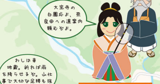
孝謙天皇と白鳳伝説