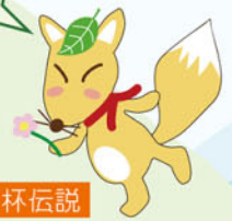
黄金千両漆万杯伝説

昔々、村の長者が黄金と漆をたりに詰めて村のどこかに埋めたんだって。どこなのかしら？探さずには今に伝わるこんな歌よ。「朝日さす 夕日かがやく木の下に 黄金千両漆万杯」