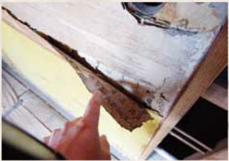
フスマの下張りに古文書が使われている例。このようなところにも大発見が隠れている。