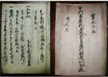
見つけた村明細帳(現在の市勢要覧のようなもの)。当時の村の人口や生業などがよくわかる。