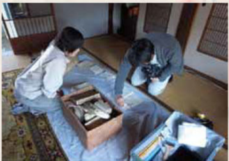
古文書調査の様子(上/下) 地域の記憶を繋ぎとめる作業が続けられている。