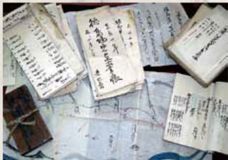
現在も市内の水田や果樹園を潤す徳島堰に関わる古文書。水に腐心した人々の苦労がわかる。

武田信玄直筆と伝わる祈願文 加賀美地区の法善寺に伝わるもの。 その価値はいままでもない。