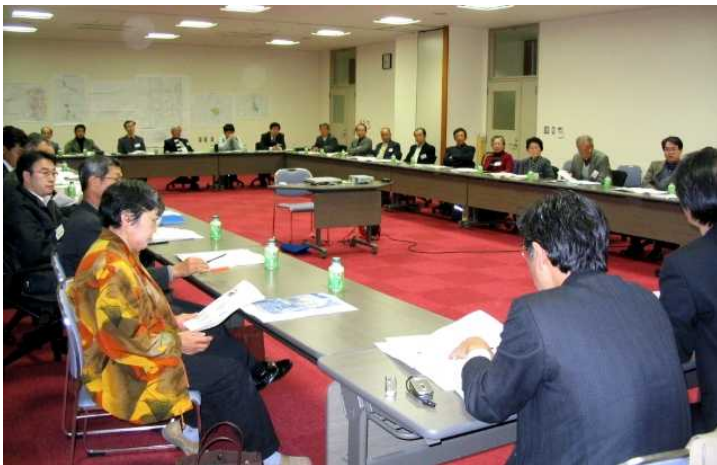
第一回まちづくり研究会開催の様子

「まちづくり研究会」での検討が進められています。まちづくり研究会は、市民の生活活動実感から市全体や地域のまちづくりについて検討し、策定審議会へ提言する組織です。平成十六年十月に実施した「まちづくりへの一言提言」とともに応募頂いた公募会員を中心として三十六名で構成されています。 第一回まちづくり研究会は、平成十六年十二月二十一日に開催され、これまでに計四回の研究会が開催され、市民意向を反映して、本市の特徴を踏まえた関連で有意義な議論が進められています。