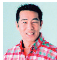
森脇 健児 (もりわき けんじ)

中学時代から陸上を始め、しかも年齢を重ねるごとに記録を伸ばしてきた息の長い選手である。過去に、1500m、3000m、5000mの3種目で同時に日本記録を持ち“トラックの女王”と呼ばれていたスピードランナー。日本代表としてオリンピックに3回出場。世界陸上には4回出場し3種目で入賞を果たしている。スピードを武器にマラソンでも2時間22分56秒をマークしているオールラウンダー。