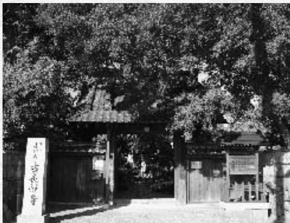
大井夫人の墓がある古長禅寺

信玄が唯一頭が上がらなかったといわれる大井夫人、実は南アルプス市と深い関わりがあり、いくつもの伝承が残されています。