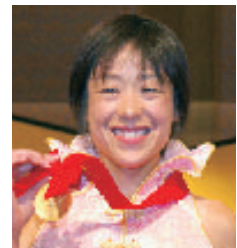
弘山 晴美 (ひろやま はるみ)

中学時代から陸上を始め、しかも年齢を重ねるごとに記録を伸ばしてきた息の長い選手である。過去に、1500m、3000m、5000mの3種目で同時に日本記録を持ち“トラックの女王”と呼ばれていたスピードランナー。日本代表としてオリンピックに3回出場。世界陸上には4回出場し3種目で入賞を果たしている。スピードを武器にマラソンでも2時間22分56秒をマークしているオールラウンダー。