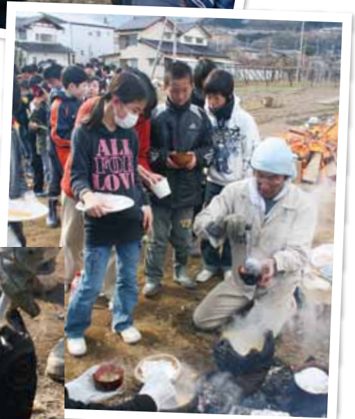
やっとスープが食べられる～！