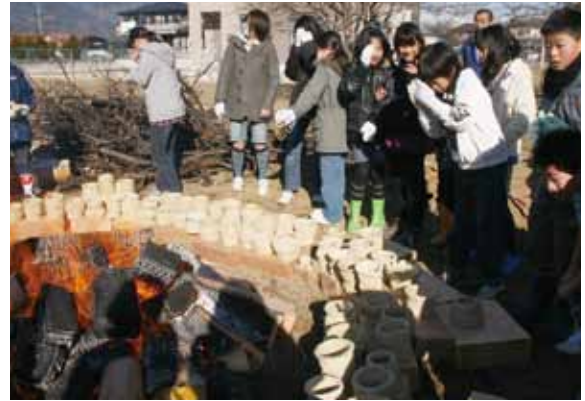
土器が割れませんように～！