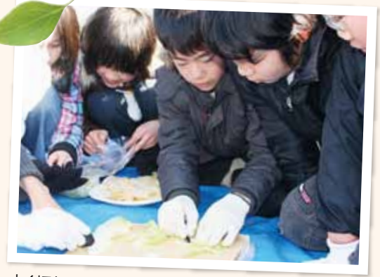
よく切れるじゃん！