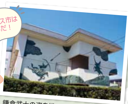
鎌倉武士の姿を描いている小笠原小学校校舎の壁