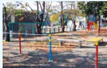
●下宮地区(神戸神社境内内広場) すべり台・ブランコ・鉄棒などの遊具