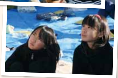
あの石皿で料理したんだ～！