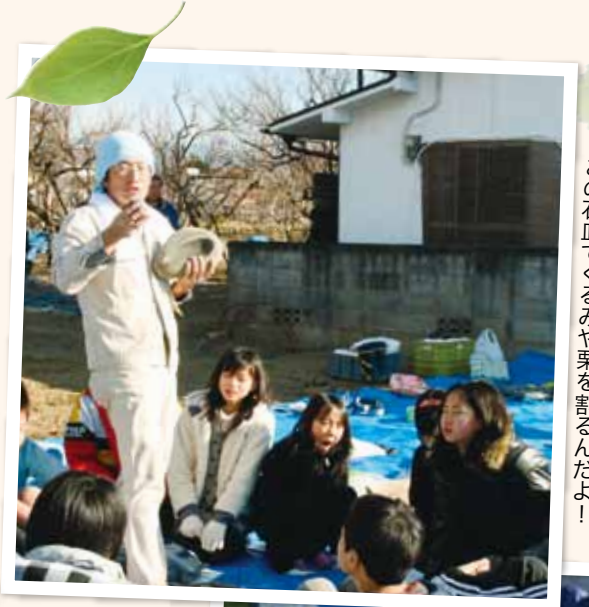
この石皿でくるみや栗を割るんだよ！