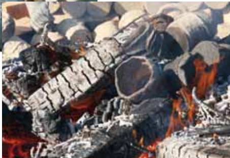
火に触れると土器の色に変化が！

同時に縄文食を作って食べるという体験も行い、野菜を黒曜石で切ることに挑戦した子どもたちは、意外に切れ味がよい黒曜石製のナイフにおどろいた様子。縄文食はあさりと白菜、鶏肉のスープと、栗や、くるみ、山芋をつぶして蜂蜜で甘さを加えたクッキー。なるべく縄文時代からある素材にこだわり縄文時代の味に近づける。派手な味付けではないが、旬の時期に天然のもの食べていた縄文人は今よりもむしろ贅沢な食事だったのかも……。くるみや栗は石皿という道具で殻を割り粉にしていく。