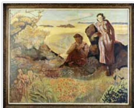
土橋芳次「春の丘憩う娘たち」