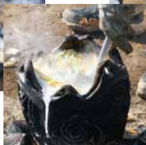
焼いた石を入れた瞬間、沸とう！