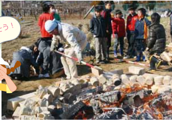
土器をいよいよ火の中へ投入