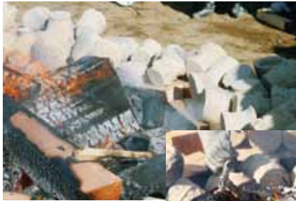
徐々に火に近づけて土器を熱していく