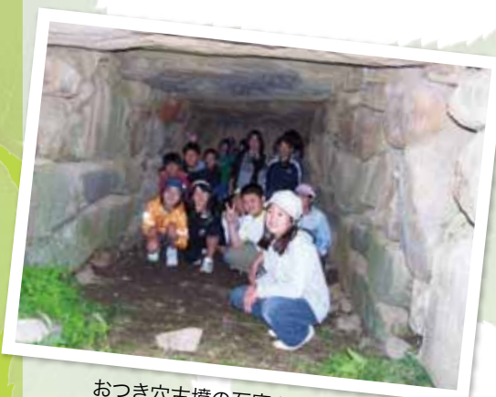
おつき穴古墳の石室を見学(白根東小学校)

小笠原小学校6年生の取組みを紹介。文化財課では2年前、4年生の時に子どもたちに出会う。御勅使川ゆかりの史跡や徳島堰が遠い所のように、実は自分たちの地域にとって重要なものであることを学習し驚いていた。