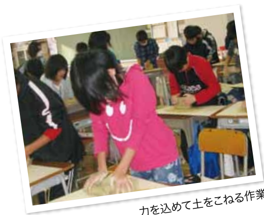
力を込めて土をこねる作業

「どうせ割れちゃうんだから……」と言いながら火の周りに並べていた子どもたちは、少し不安げな様子。割れるか気になる子どもも……。自分たちが作った土器が徐々に完成に近づいていく。