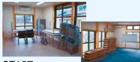
●百々5区 (集会場の備品)会議用テーブル・ホワイトボード・折りたたみ式パイプイスなど