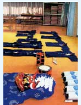
●西南湖区 獅子舞用備品