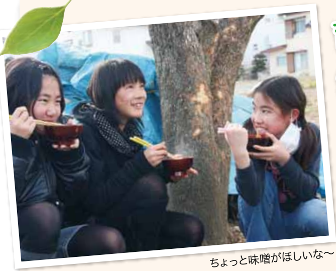
ちょっと味噌がほしいな～