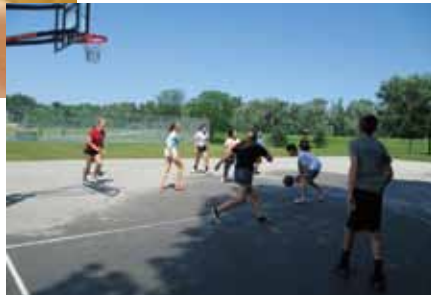
マーシャルタウン市にて