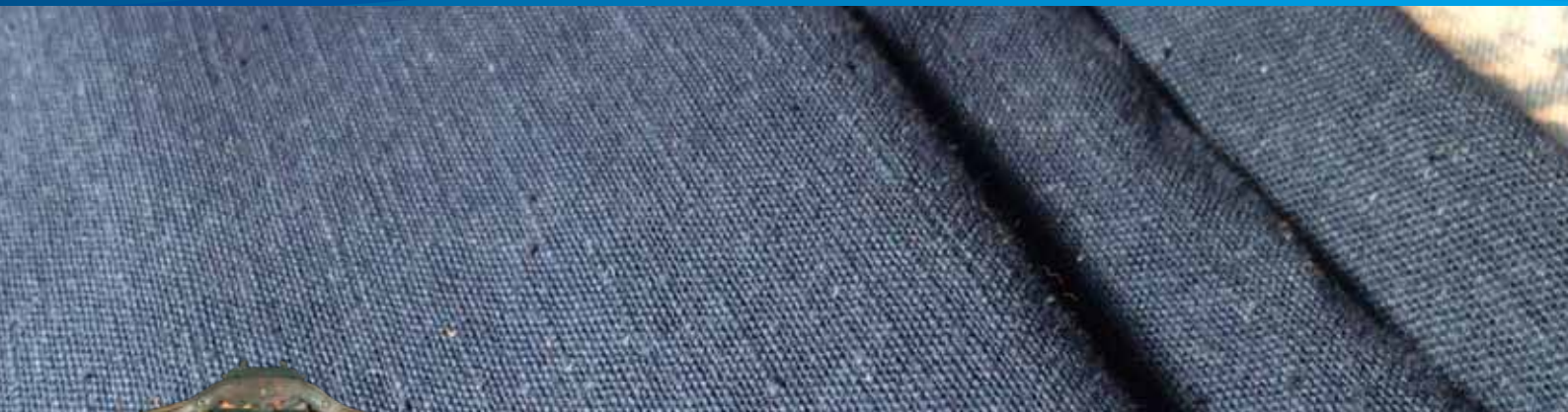
上：数世代使われた藍甕(あいがめ)とその内側／下：藍染の暖簾(のれん)井上染物店

藍で染められた紺色は明治初期に来日した英人研究者によって「ジャパンブルー」と称えられ、現在では日本を代表する色となりました。市内でも江戸時代から明治時代中ごろまで広く藍が栽培され、「紺屋(こうや)」と呼ばれる藍染屋がいくつも存在していました。