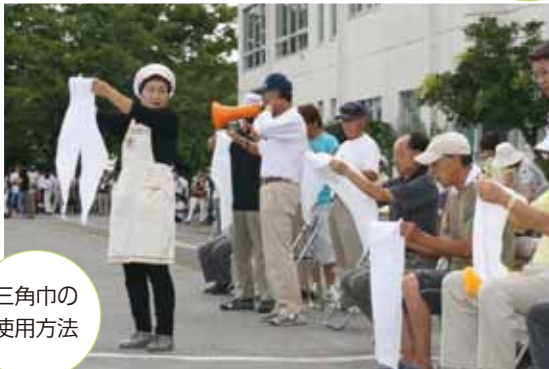
三角巾の 使用方法