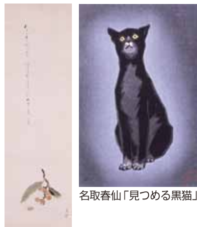
名取春仙画 柳原白蓮詩 「枇杷」