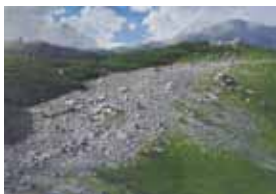
写真と見まごうほどのリアリズム

幼いころより自然に親しみ、その素晴らしさやメッセージを持ち前の繊細な感覚や研ぎ澄まされた美意識で絵を描くことによって表現し、私達に伝えてくれていました。1988年9月、悪天候に敗れて遭難、38歳の短い命でした。