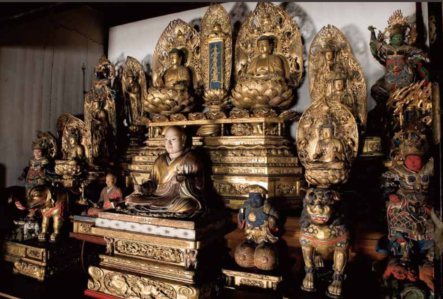
長遠寺本堂（鏡中条）

総本山、身延山久遠寺に地理的に近いこともあり、現在南アルプス市内にあるお寺のうち、実に約四割のお寺が日蓮宗のお寺で、最も数の多い曹洞宗に次ぐ寺院数を数えます。