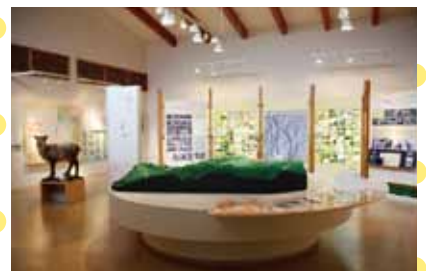
南アルプス芦安山岳館(芦安芦倉) 2003年に開館した、山岳文化と自然のミュージアムです。 9:00～17:00 / 水曜定休