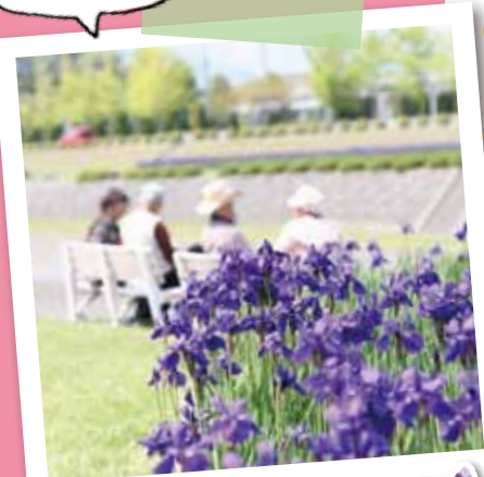
「いずれ菖蒲か…」 アヤメとしょうぶ、花は違えど 漢字は同じなんだね!