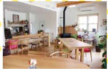
沢登農園カフェ&バル (十五所) 自家製の野菜や果物を使ったランチやスイーツが人気。 / 11:30 ~ 16:00 (ランチ) 17:30 ~ 21:00 (バー) / 月曜定休