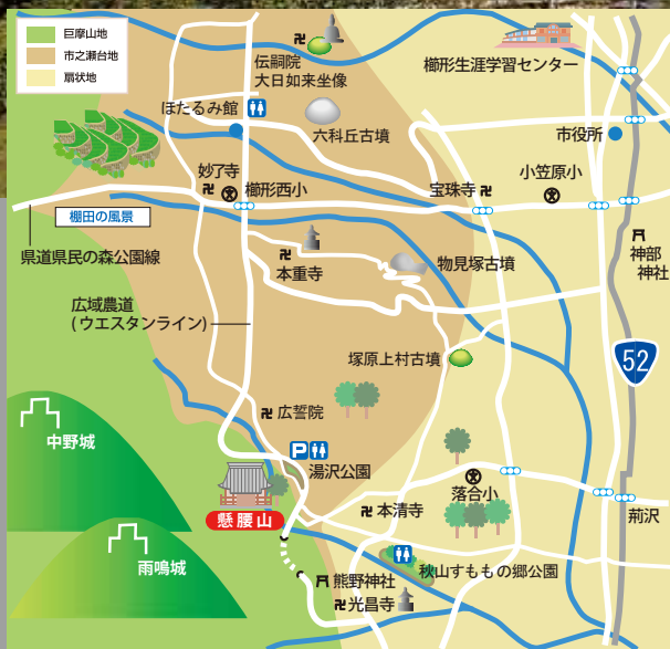
懸腰山の位置（南アルプス市湯沢1345-1）

かつては、一日三回時を知らせ、朝は「懸腰山の鐘が鳴るぞ、起きろ」と子供たちを起こし、昼は畑で聞いて昼休みにし、夕方の鐘で家路に急ぐといったように人々の生活に密着していた。写真は、昭和16年（1941）の春、戦争のために供出される際に撮影されたもの。