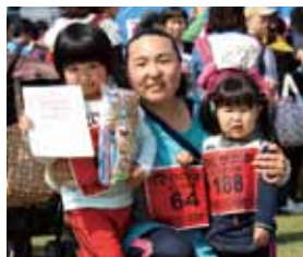
キッズレースに参加(市内)