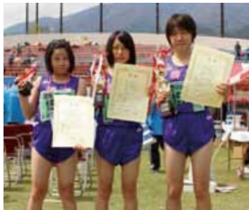
女子中学生5kmで入賞した 櫛形中ランナー