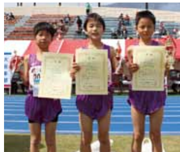
男子3.5km小学生の部で入賞した 市内の小学生