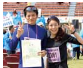
前日入籍し、カップルの部で 優勝しました