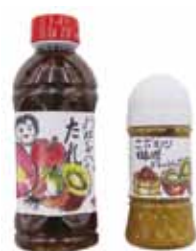
はっぴい倶楽部により開発された商品

市の地域資源を活用し、新たに農業の6次産業化※1（研究・商品開発、販路拡大）に取り組む市内の農業団体を応援します。