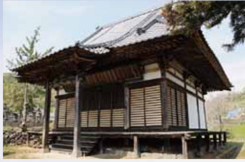
日蓮聖人をまつる祖師堂