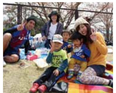
家族で毎年参加しています(市内)