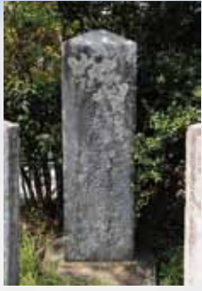
日蓮大菩薩懸腰所の石碑