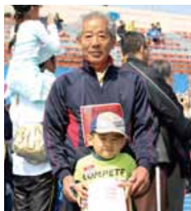
おじいちゃん とキッズレースに参加