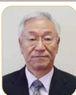
野中国幹 (のなかくにみち)