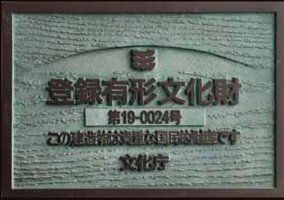
登録有形文化財になると文化庁から交付されるプレート

文化財保護のかたちは、みなさんが普段よく耳にするであろう『国宝』や『重要文化財』といった指定文化財だけではありません。今回はその一つ、『登録有形文化財』について、市内の例を取り上げながら紹介します。