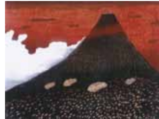
《曙富士》 木版 1990～91年