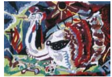
《失楽園》 木版 1955年

お問合せ／南アルプス市立美術館 TEL.282-6600 FAX.282-6601