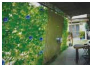
個人最優秀賞（内側）