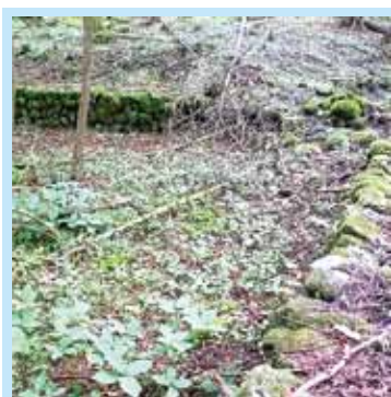
現在の氷池の内部。川の流れが変わったことで水を引けなくなり氷作りを終えたと伝わる。このお宅には氷作りに使用された道具も残されている。