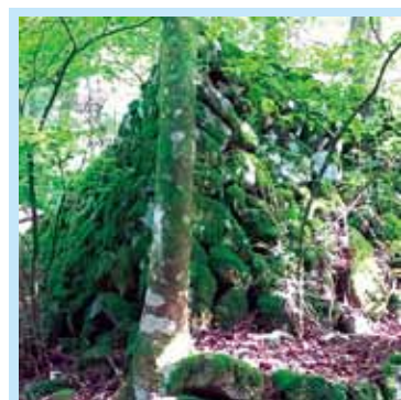
氷倉から深沢川をはさんだ対岸に整然と並んだ石積みが見え、現在も2枚並ぶ氷池の外観はその姿をとどめている。深沢川から水を引き込んだ水路跡なども残っている。