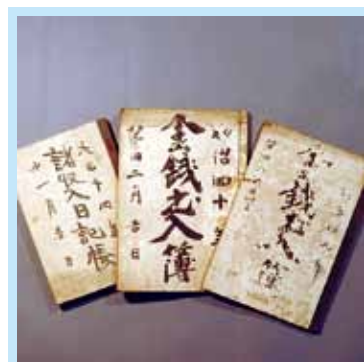
このお宅に残されていた氷作りに関する史料は明治39年までさかのぼり(右端)、すでに「氷日当」の文字が見える。昭和の史料からは、「氷出し」「氷積込ミ」「氷倉土方」と具体的な作業内容がうかがえる。