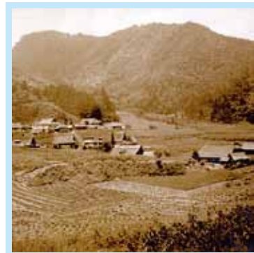
昭和30年代前半のころの高尾集落の様子。かやぶき屋根の家並みがうかがえる。氷作りや炭焼きなど、山の資源を活かした暮らしが盛んだった頃といえる。