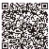
デング熱 厚生労働省