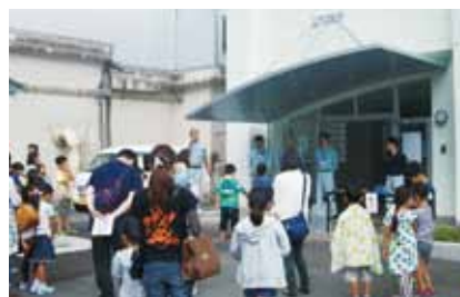
駒場浄水場見学会

本年10月以降の検針分より平均改定率17%の値上げを行いますので、先般より検針にあわせて「南アルプス市企業局（水道）からのお知らせ」を配布し、周知を行っています。今後も経営努力し、安全、安心な「美味しい水」を安定してお届けしますので、皆さまのご理解とご協力をお願いします。