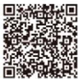
ジカ熱 厚生労働省