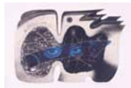
凍れる歩廊 (ベーリング海峡)

開館時間／9:30～17:00(入館は16:30まで) 休館日／月曜日(月曜日が祝日の場合はその翌日) 入館料／一般 300円 大高生 250円 中小生 150円 (20名以上団体料金2割引)