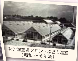
刃刀園芸場 メロン・ぶどう温室 (昭和5~6年頃)