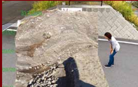
写真の中の方は実際に遺構が見えているわけではありません。スマホを通すとこのように見えます。

アプリを起動して眺めると調査時の土層が見えます。眺望ポイントには解説板もあるので見えている遺構の内容などがわかります。