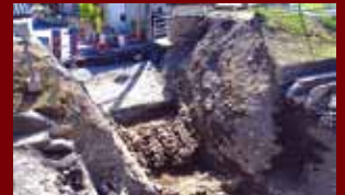
第2地点の調査中の様子。

アプリを起動して眺めると調査時の土層が見えます。眺望ポイントには解説板もあるので見えている遺構の内容などがわかります。