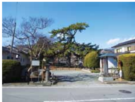
宝珠寺 中央にみえる立派な松の木も県指定の天然記念物となっています。