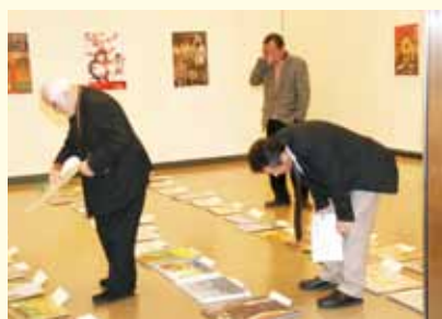
春仙美術館で作品審査が行なわれ、受賞作品が決定しました。