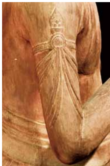
大日如来の腕飾り。とても繊細な彫り方です。