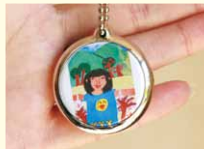
応募者全員に記念品として、自分の作品をキーホルダーにしてプレゼントしています。