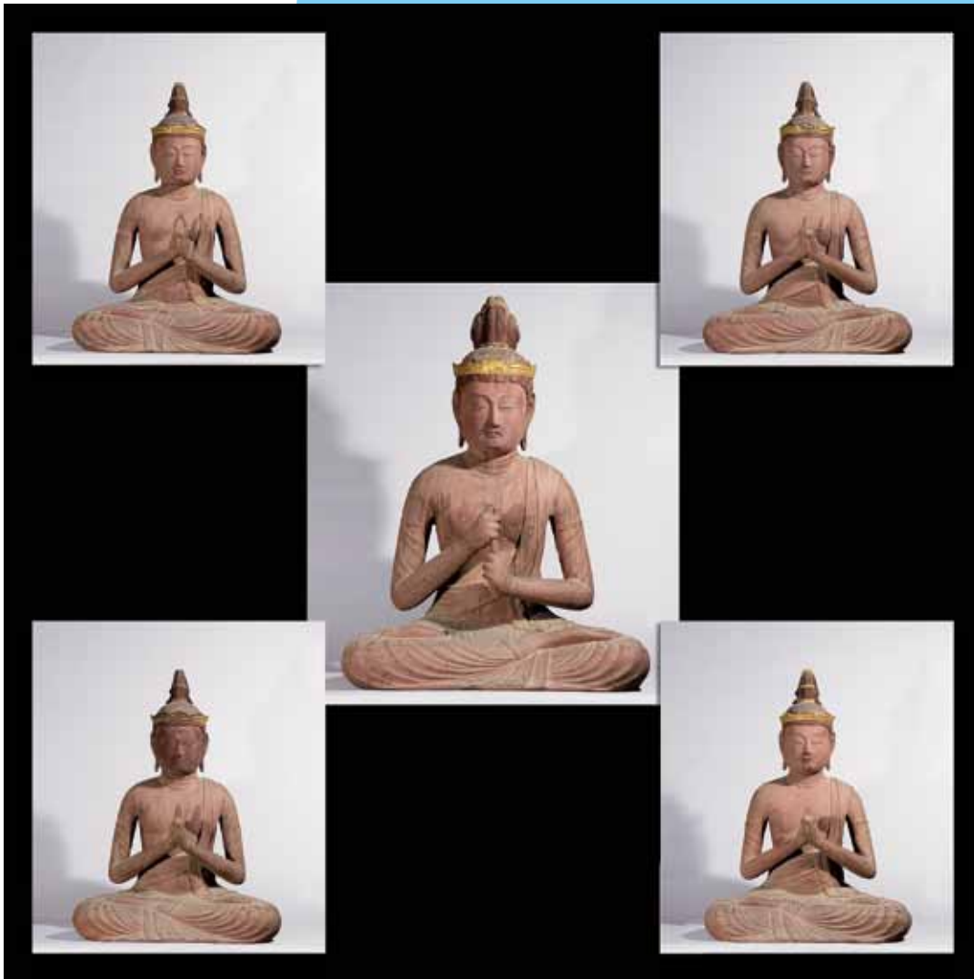
大日如来及び四波羅蜜菩薩坐像

南アルプス市山寺の宝珠寺(ほうしゅうじ)に安置された仏様です。密教において宇宙の中心(または宇宙そのもの)を現すといわれる座高1mほどの「大日如来」を中心に、それより一回り小さい4体の菩薩像が周囲を囲みます。