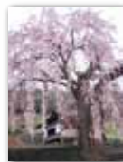
上市之瀬のイトザクラ