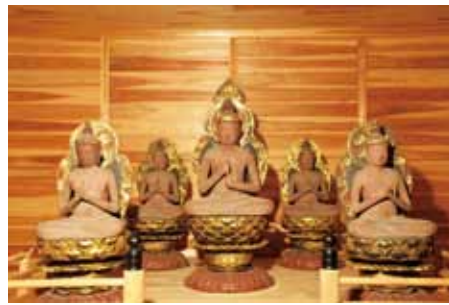
お寺に安置される様子。通常は宝珠寺の収蔵庫に大切に安置されています。