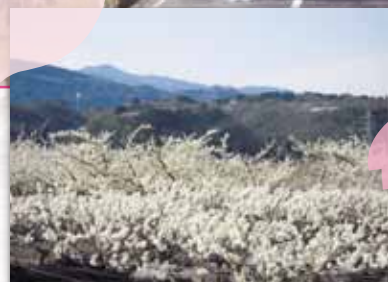
落合地内のスモモ畑

URL http://www.minami-alpskankou.jp/sakuraichirann.html