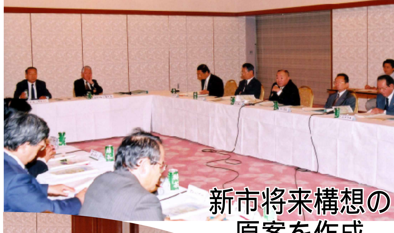
活発な議論が行われた、第3回新市将来構想策定小委員会（白根桃源文化会館）