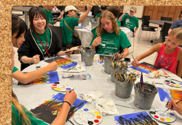
"Pôr do sol de Iowa" em andamento