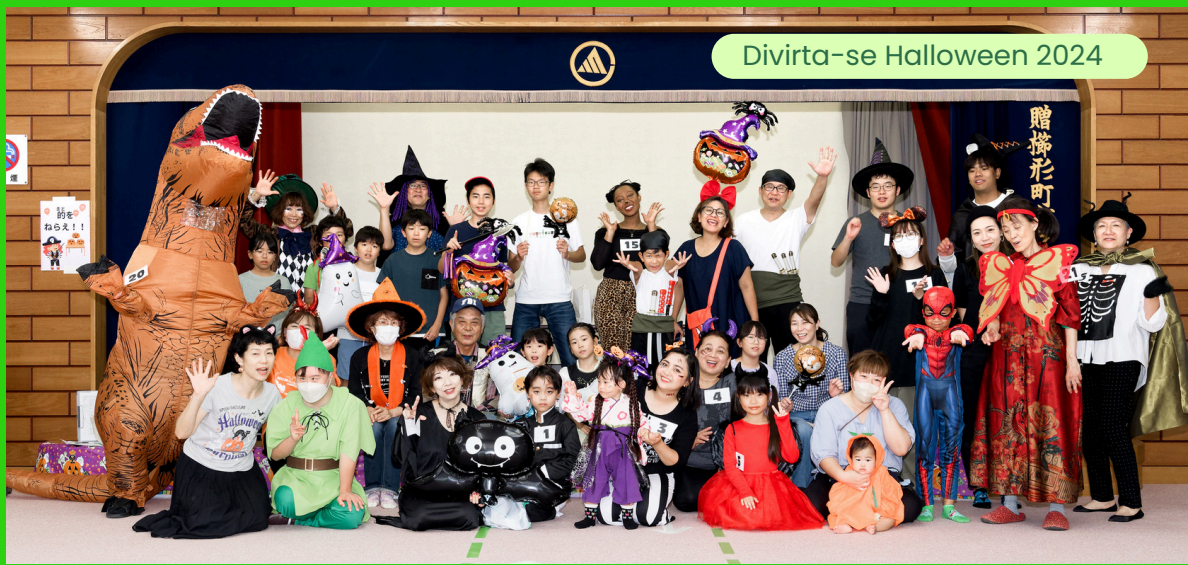
Divirta-se Halloween 2024