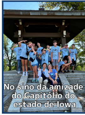
No sino da amizade do Capitólio do estado de Iowa

Os alunos visitaram o Capitólio Estadual de Iowa, lar do "Sino da Amizade", e aprenderam sobre a história dos intercâmbios.