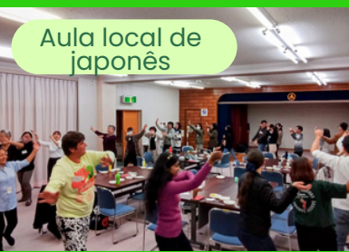
Aula local de japonês