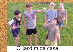
O jardim da casa é enorme!