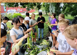
O milho é uma delícia!