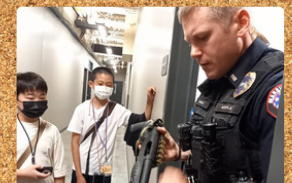
Passeio emocionante pela delegacia de polícia