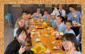
Comparação do McDonald's no Japão e nos EUA