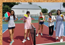
Pickleball que está na moda

Localizada a cerca de 80 km a nordeste da capital do estado, Des Moines, a cidade tem uma população de aproximadamente 27.000 habitantes.