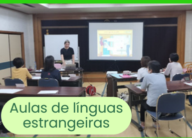
Aulas de línguas estrangeiras