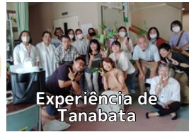
Experiência de Tanabata

Foi quando terminei de ler as duas frases: "Ele pegou cinco peixes no rio" e "Ele levantou a mão em hesitação". "Ah, minha caligrafia." (Você sabe quem disse isso?)