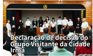
Declaração de decisão do Grupo Visitante da Cidade Irmã

O Programa de Intercâmbio de Cidades Irmãs, que havia sido suspenso devido à pandemia de COVID-19, foi retomado pela primeira vez em cinco anos.