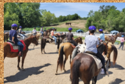
Passeio a cavalo na floresta