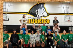
O ginásio é lindo!