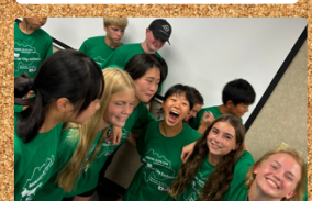
Nós nos tornamos amigos além das fronteiras!