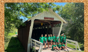
A famosa ponte coberta