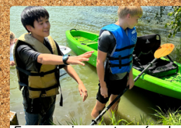
Faça amigos através de atividades ao ar livre!