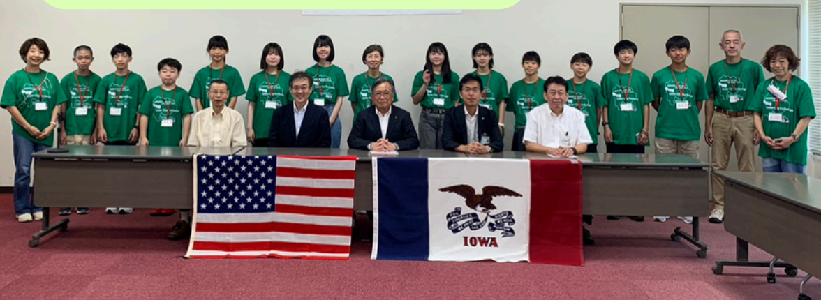
Cerimônia de Partida da Delegação de Intercâmbio de Cidades Irmãs Americanas