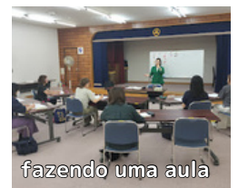
fazendo uma aula

No segundo semestre do ano, realizamos quatro sessões em coreano e inglês em janeiro e fevereiro. Sinta-se à vontade para participar de nossas aulas de línguas estrangeiras.