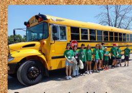
Passeio pela cidade em um ônibus escolar