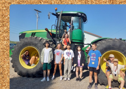
tratores são grandes!