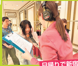
日帰りで新宿へ帰る方も安心