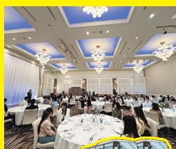
2台合流! みんなでコースランチ