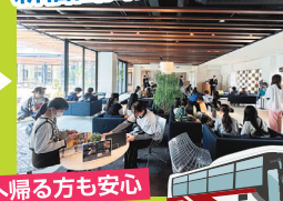
甲府駅南口or 新宿西口にて解散