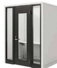
リモートキャビン ダブル Remote Cabin VV