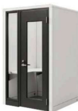
コンフォートクラス Comfort Class