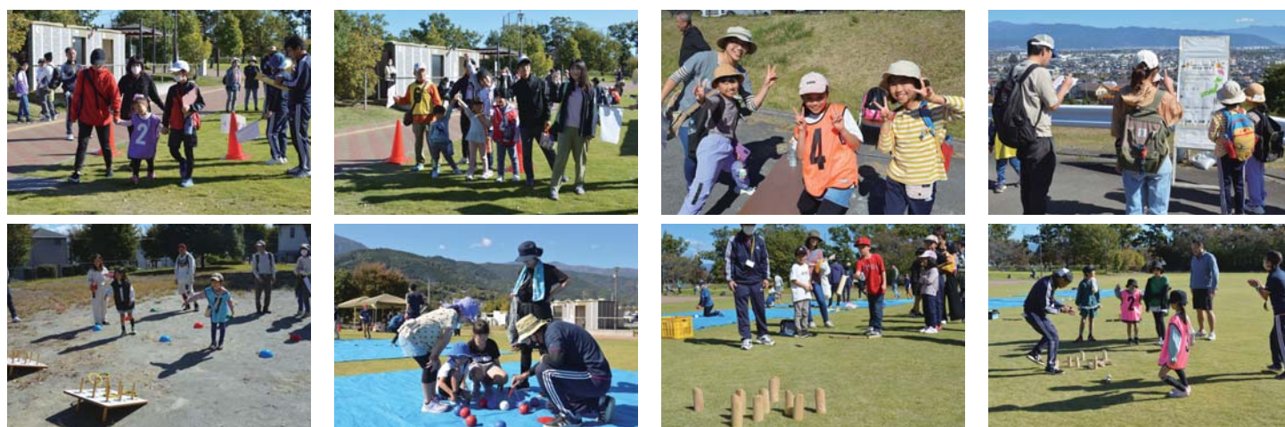
昨年のウォークラリー大会（櫛形地区）での様子

主催：南アルプス市スポーツ推進委員会・共催：南アルプス市教育委員会 お申込み・お問合せ 南アルプス市教育委員会生涯学習課 〒400-0492 山梨県南アルプス市鮎沢 1212 TEL055-282-7778 FAX055-282-6427（郵送・FAX可）