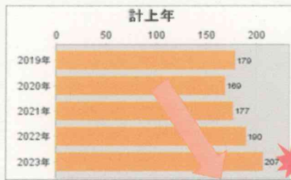
過去5年間の事故件数