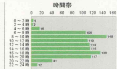
過去5年間の時間帯別事故件数

また、南アルプス警察署管内の事故件数は、2020年から2023年にかけて右肩上がりとなっています。