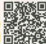
飲酒運転情報提供 BOX