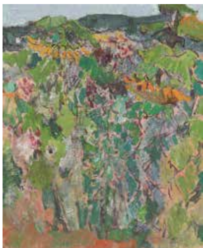
佐野智子《ひまわり》