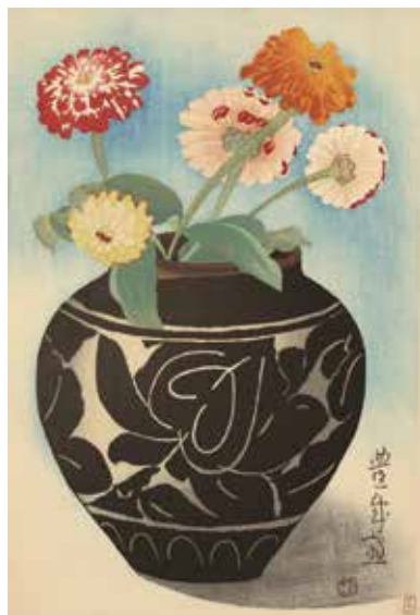
山村耕花《壺と百日草》