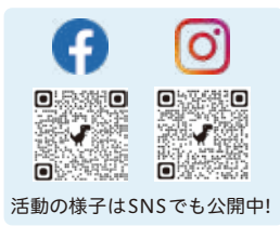
活動の様子はSNSでも公開中!