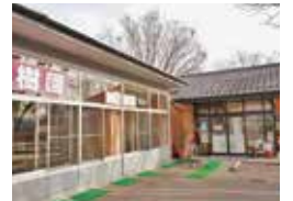
農業体験実習館「樹園」