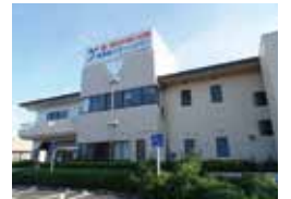
遊・湯ふれあい公園