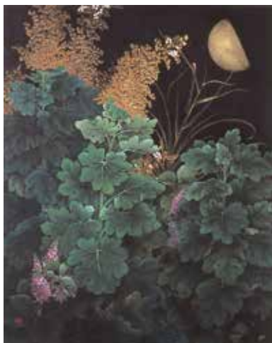
齊藤弘子《夜の競宴》