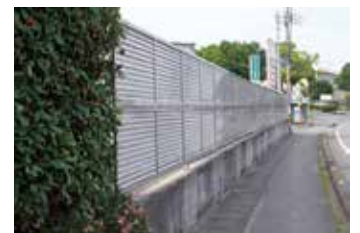
ブロック塀の改修例

◆対象 本市耐震改修促進計画において、避難路または通学路に接する敷地のブロック塀等の所有者で、市税の滞納がない方。