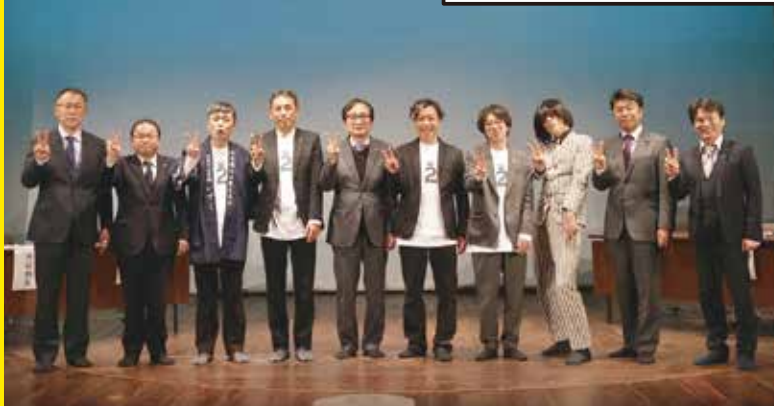
第3回 No.2 サミットに集った全国のNo.2

そして、日本の No.2 スポットをめぐる楽しい企画もスタートしています。観光としてはもちろん地元のみなさんにも楽しんで足を運びきっかけになってもらえればと思っています。