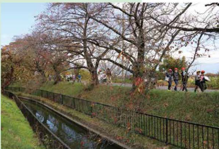
南アルプス市内を流れる徳島堰。現在は、市内外の小学生たちが、先人の知恵を学ぶ場ともなっている。