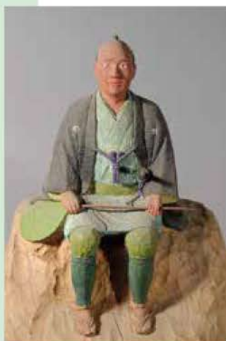
徳島兵左衛門（了円寺蔵）