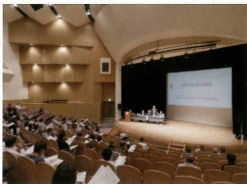
あやめホールでの意見交換会の様子

安否確認のしくみや避難行動要支援者の支援策、防災リーダーの役割などについて意見交換を行った結果、自主防災会内における防災リーダーの役割や立ち位置の地域間格差の改善が直近の課題であると受け止めました。自主防災会、南アルプス市、防災リーダー連絡協議会、それぞれの課題解決に向けた今後の対応を協議してまいります。