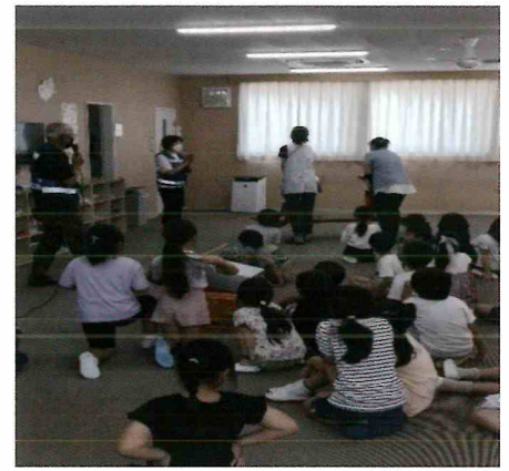
夏休み子ども防災スクールの様子

今年度も市内14カ所の児童クラブで開催し、地震災害への備え、応急措置、消火器・無線機の使い方などを指導しています。