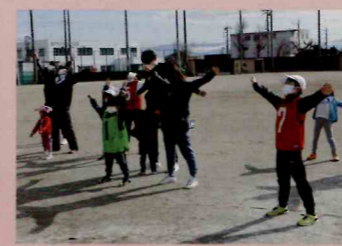
▲ラジオ体操・ストレッチ