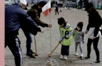
▲グラウンドゴルフ