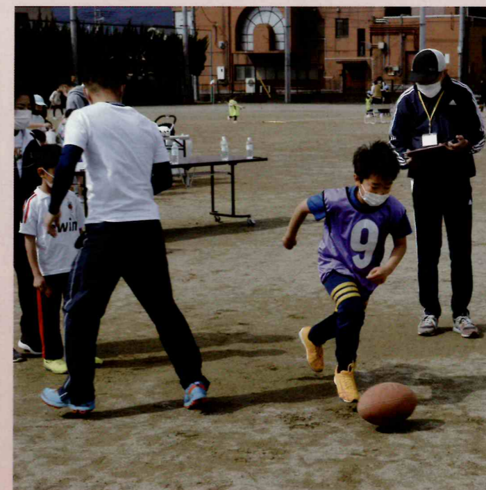
▲ラグビーボール・ドリブル