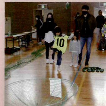
▲シューティングスリッパ