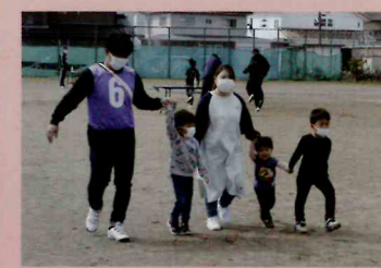
▲ドタバタ・ウォーキング