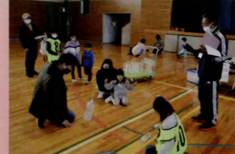
▲ペットボトル立たせ