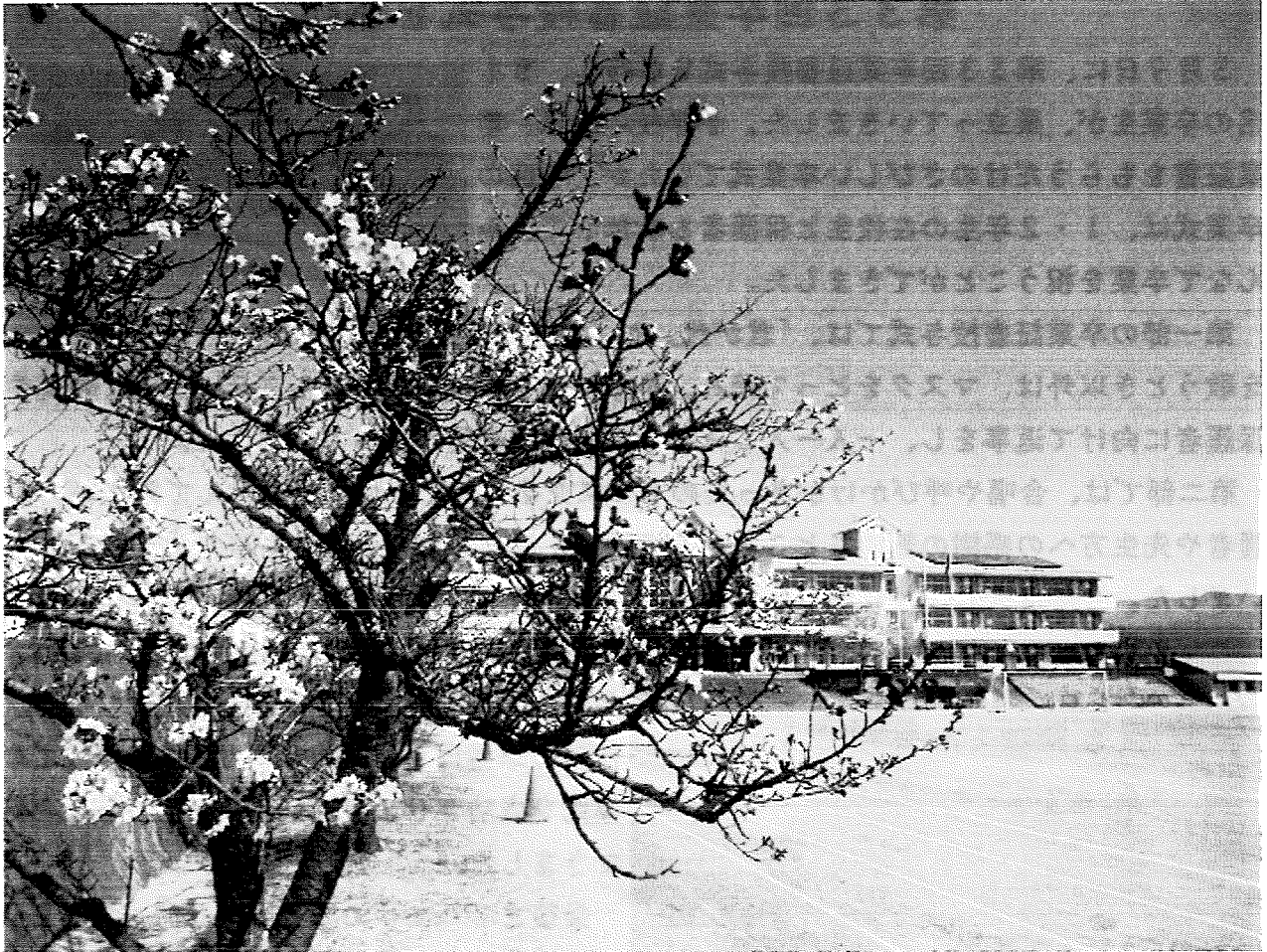
校庭の桜も咲き始まりました（R5. 3. 22撮影）

来年度も、小中一貫教育のさらなる推進、コミュニティ・スクールとしての地域との連携に取り組んでいきますので、引き続きのご協力をお願いします。