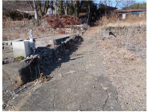
東側の道 左側が当該地