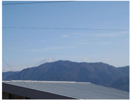
富士山も少し見えます。