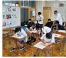
豊小学校の「切子クラブ」。30年以上にわたり指導を行っている。

地元の小学校への切子の指導や、定期的な講習会の実施、さらには多くのイベントに参加して実演・体験・展示などを行い、後継者の育成と切子の継承に努められています。