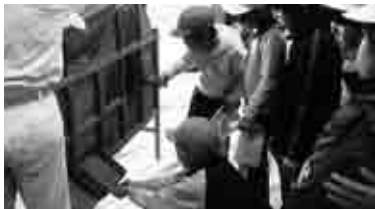
いろんなものにふれてみる