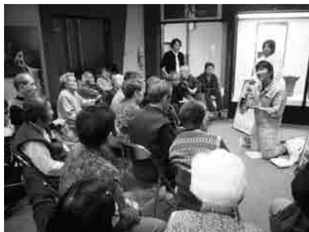
デイサービスを利用するお年寄り