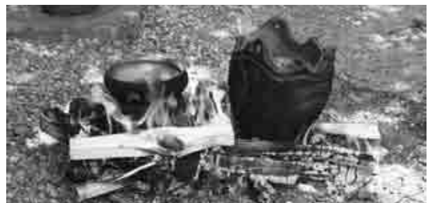
さまざまな教育普及事業