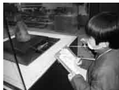
ふるさと文化伝承館の活用