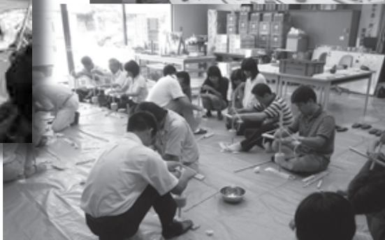
小学校教員のための研修